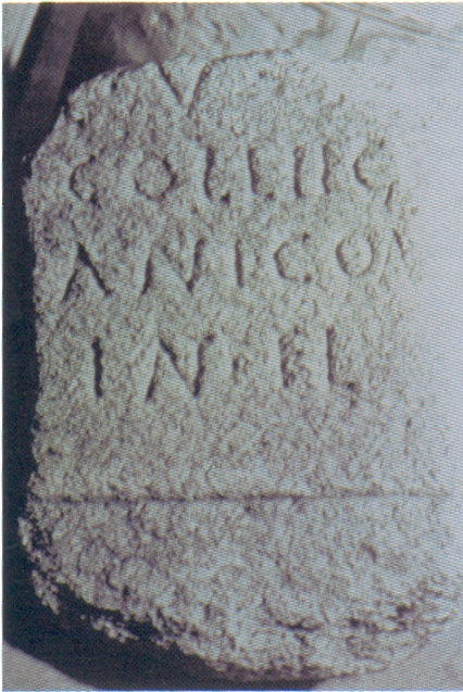
Fig. 9. Inscripción de Noceda, en la que se menciona Interamnium Flavium.